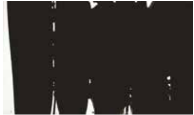
Peinture 220 x 366 cm, 14 mai 1968 Huile et peinture acrylique sur toile Pierre Soulages