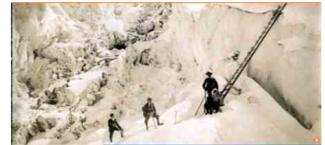
B Quatre guides sur le glacier des Bossons, avant 1914.

Trois livres, un film, une exposition et un timbre à l'effigie de la Compagnie retracent ses 200 ans. Programme des événements : www.chamonix-guides.com