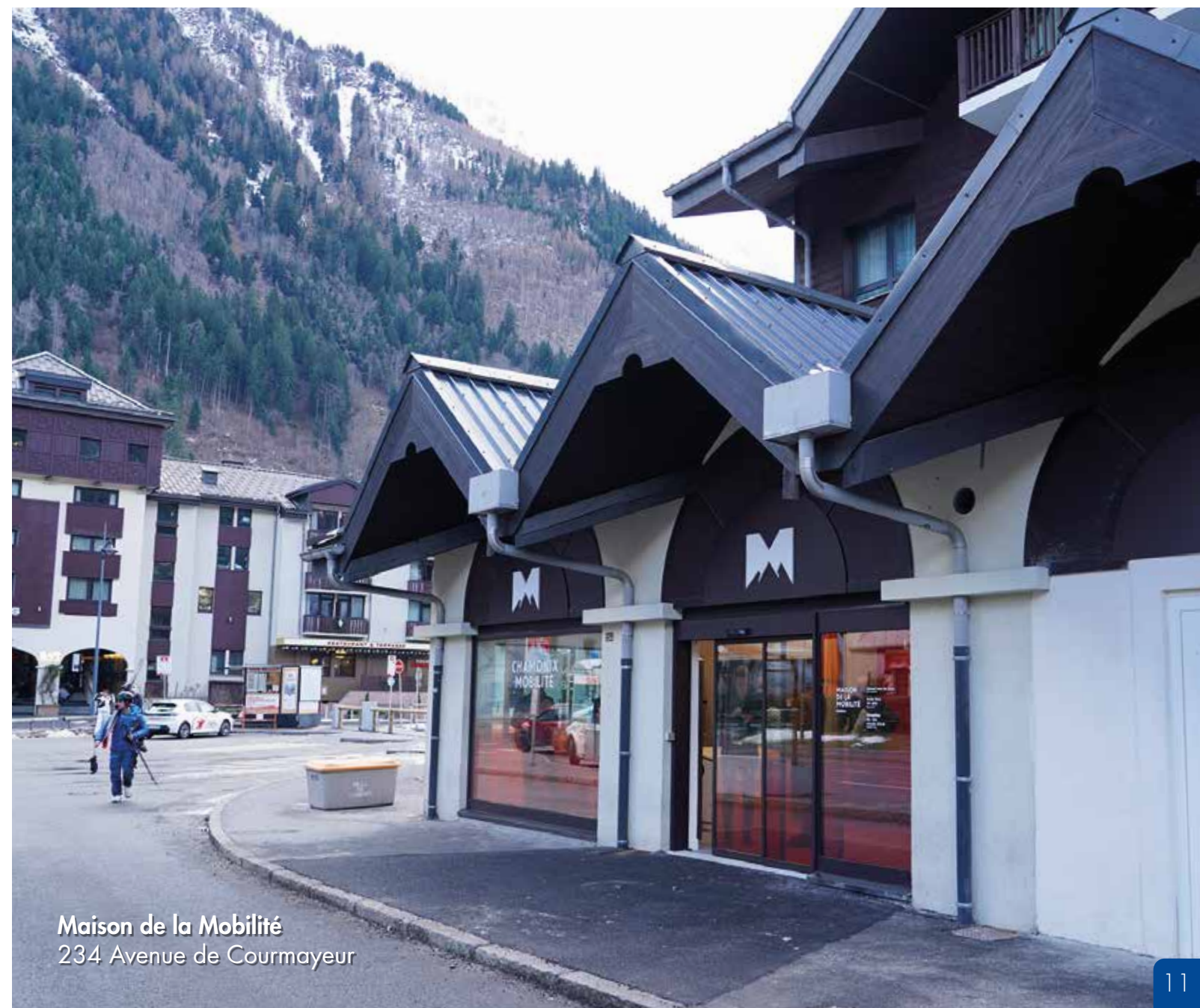
Maison de la Mobilité 234 Avenue de Courmayeur